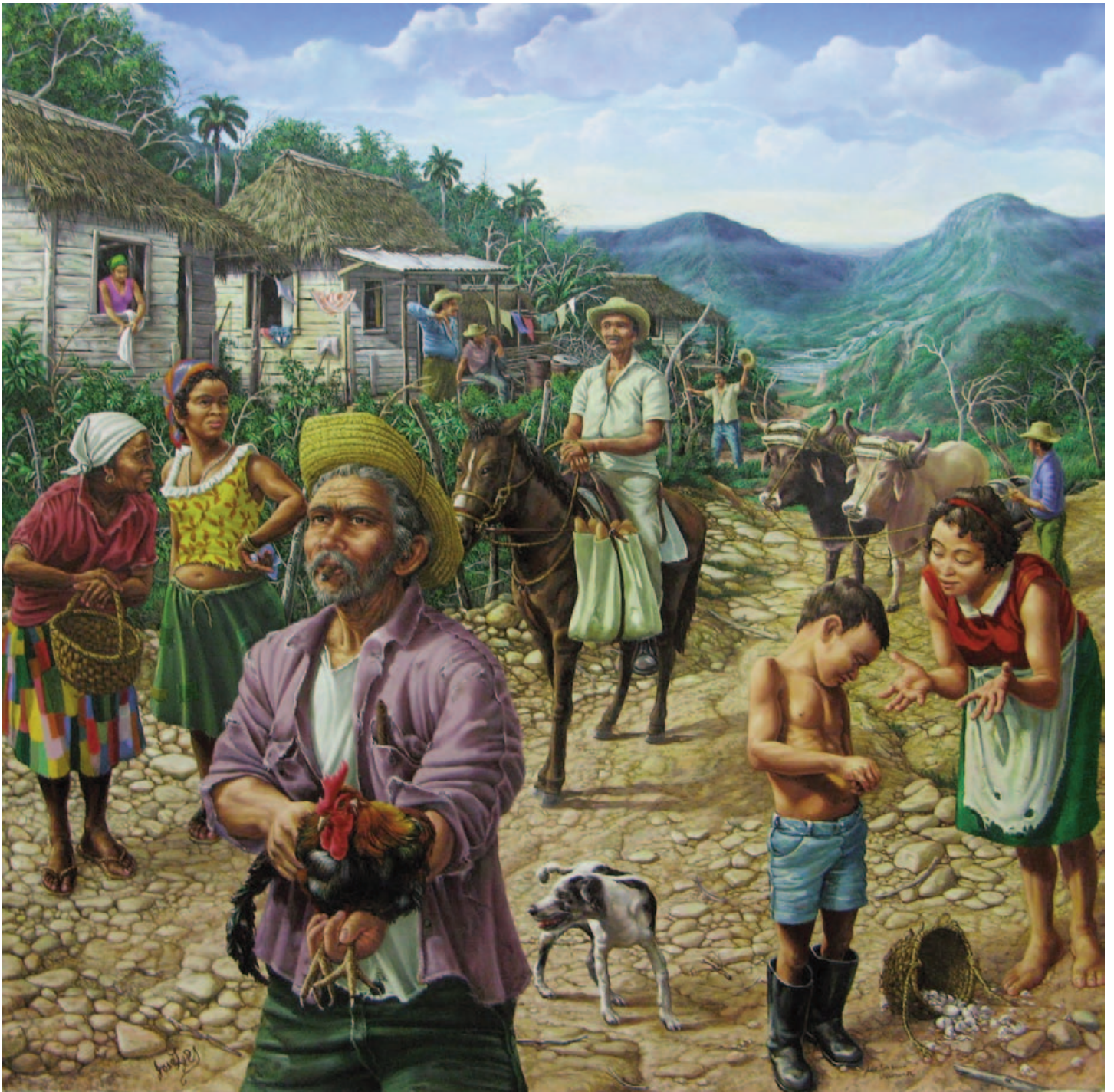
Pintura de José Luis García Villagomez