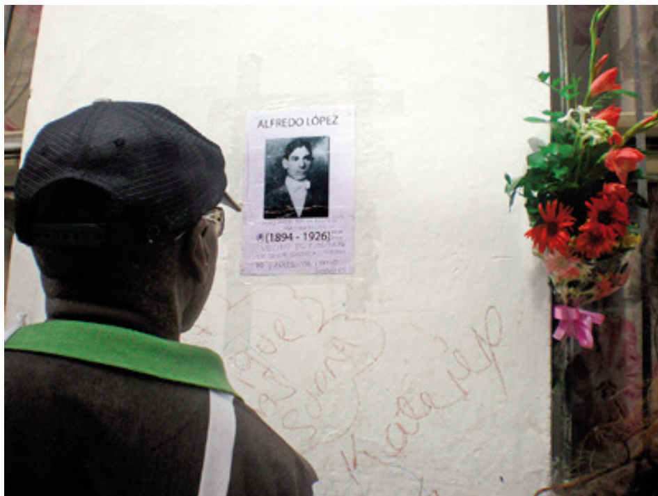
Homenatge a Alfredo López, La Habana 2013

Actualmente, movimientos obreros, libertarios, sindicales, socialistas, o sociales de manera general, mantie-