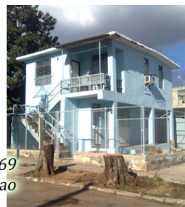
124 y 69 Marianao